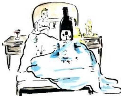
THE SOMMELIER / by Brand Lee Wise Art https://www.brandonleewiseart.com/