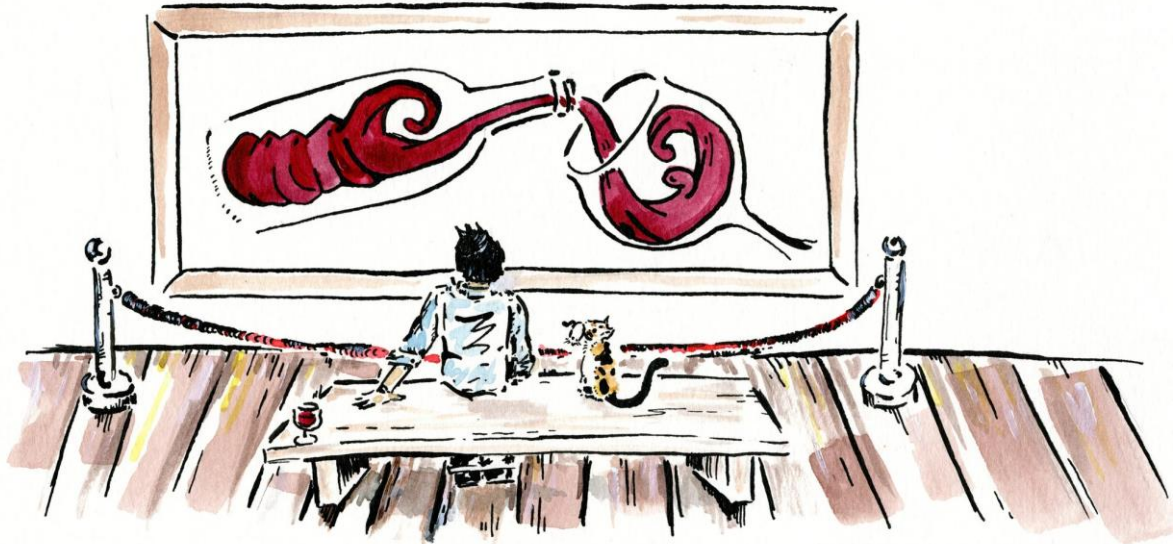
WHAT IS ART WORTH / by Brand Lee Wise Art https://www.brandonleewiseart.com/