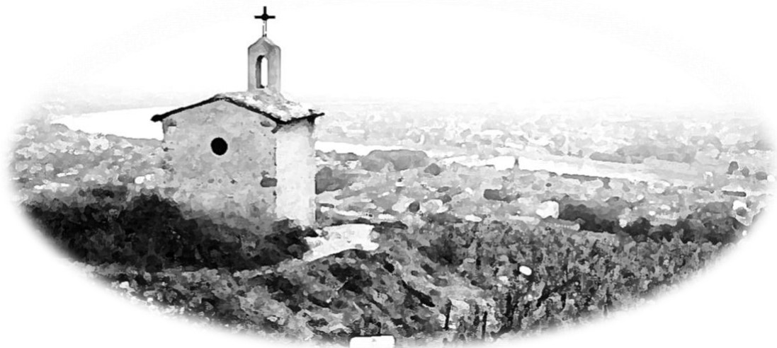
Chapel built by the knight Gaspard de Stérimberg on top of the Hermitage hill

The area offers amazing diversity in terms of grape varieties. A tremendously happy vibe emerges when you are visiting the region. Winemakers are constantly innovating, your enjoyment of one of these bottles is a fulfilment of their passion.