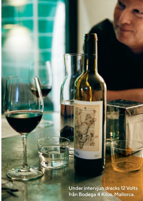
Under intervjun dracks 12 Volts från Bodega 4 Kilos, Mallorca.

lokala krogscenen i länderna där de är verksamma.