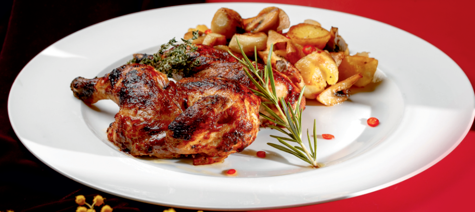
CHICKEN WITH BABY POTATOES Цыпленок с молодым картофелем 7800 ₮