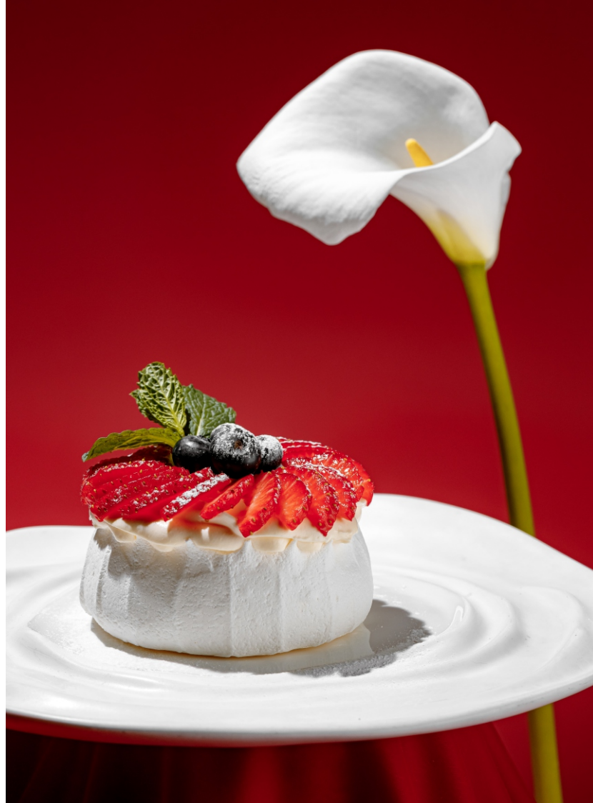
PAVLOVA DESSERT Десерт Павловой 4500 ₺